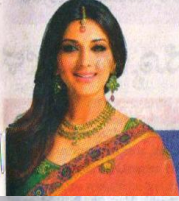
ಸೋನಾಲಿ ಬೇಂದ್ರೆಗೆ ಕ್ಯಾನ್ಸರ್: ಉಳಿವಿಗಾಗಿ ಹೋರಾಡುವೆ ಎಂದ ಬಾಲಿವುಡ್ ನಟಿ P10